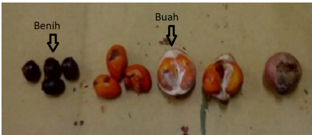
Gambar (Figure) 2. Buah dan benih Aphanamixis polystachya ( Aphanamixis polystachya fruit and seeds)