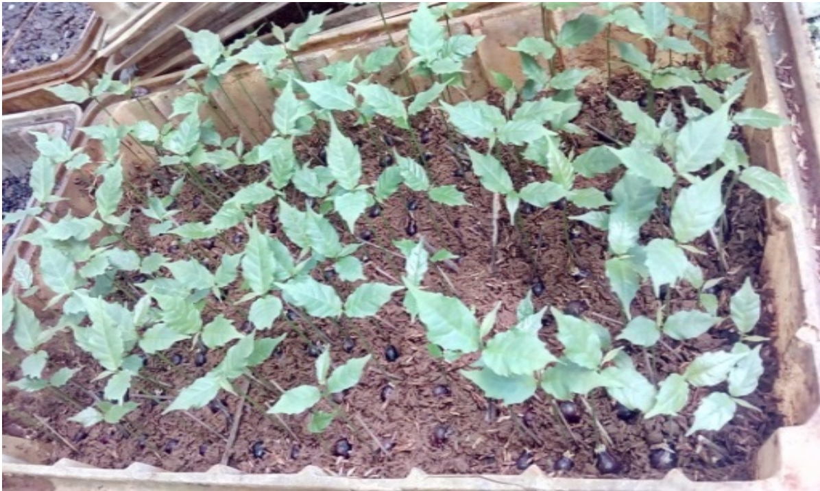
Gambar (Figure) 6. Aphanamixis polystachya 30 hari setelah tanam ( Aphanamixis polystachya 30 days after planting)

Berdasarkan hasil analisis sidik ragam berbagai perlakuan media berpengaruh nyata terhadap parameter nilai kecambah benih kayu gula. Perlakuan media pasir memiliki nilai kecambah tertinggi yaitu 13,80 %. Sedangkan nilai kecambah terendah adalah pada media tanah 7,52%. Benih dengan nilai kecambah tinggi juga akan mampu tumbuh menjadi bibit dengan optimal (Tambunsaribu et al. , 2017).