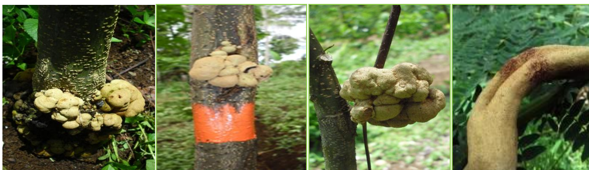
Gambar 1. Serangan karat tumor terhadap beberapa bagian tanaman sengon (batang, cabang dan ranting) yang diuji di lapangan

Timur dan Jawa. Hasil-hasil tersebut menggambarkan bahwa tingkat ketahanan setiap provenan terhadap penyakit karat tumor berbeda-beda. Bell (1982) menyatakan ketahanan berhubungan dengan kemampuan tanaman untuk mencegah, menghambat ataupun memperlambat perkembangan penyakit. Meskipun demikian, provenan-provenan tersebut perlu terus dievaluasi lebih lanjut sehingga dapat diketahui provenan yang benar-benar resisten sebagai dasar untuk pengembangan hutan tanaman sengon ke depan.