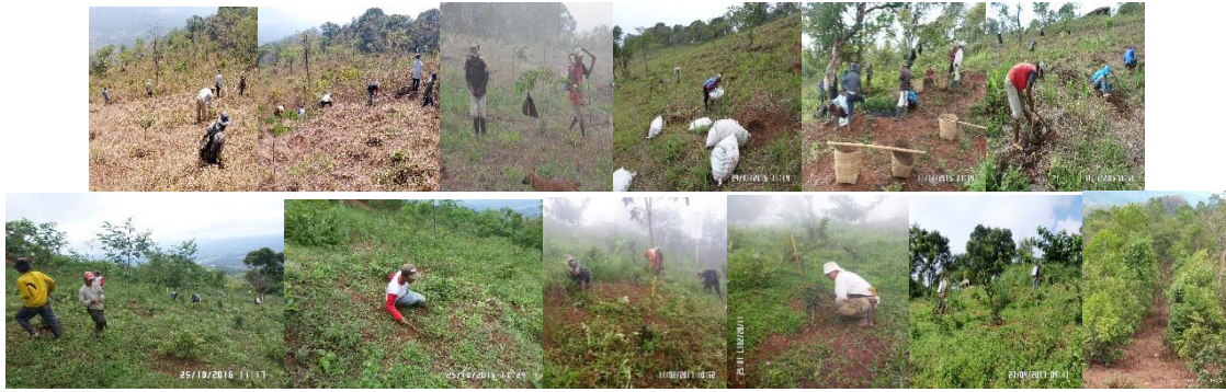
Gambar 3. Kegiatan persiapan lahan, penanaman dan pemeliharaan agroforestri jamblang yang dilakukan bersama masyarakat