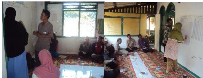
Gambar1. Diskusi kelompok bersama masyarakat dalam rangka menggali data potensi dan masalah Figure 1. Group discussion with the community in exploring the potentials and problems

Beberapa kegiatan yang dilakukan bersama-sama masyarakat dalam proses awal pembangunan demplot diantaranya diskusi kelompok dalam penggalian data dasar sosial ekonomi dan budaya masyarakat setempat pada tahun 2015 (Gambar 1).