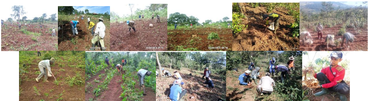
Gambar 4. Kegiatan penanaman, pemeliharaan, dan pemanenan jahe dan kunyit di demplot agroforestri jamblang yang dilakukan bersama masyarakat

diberi kepercayaan dalam mengelola demplot agroforestri jamblang di lahan desa mereka, dengan harapan membangun rasa memiliki dan menumbuhkan rasa tanggung jawab mereka terhadap keberhasilan pembangunan demplot agroforestri jamblang. Hal ini senada dengan pendapat Wadu (2016) bahwa salah satu bentuk partisipasi masyarakat diantaranya dilakukan bersama-sama dengan orang lain atas dasar kesepakatan, keterlibatan emosi, dan tujuan tertentu. Petani Desa Linggajaya menyadari bahwa lahan demplot merupakan aset desa, dan mereka memiliki harapan besar untuk menjadikan demplot agroforestri tanaman obat berbasis jamblang sebagai agrowisata untuk memajukan desa mereka.