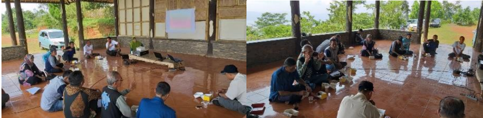
Gambar 5. FGD mengenai evaluasi pembangunan demplot agroforestri jamblang serta rencana pengembangannya Figure 5. FGD on the evaluation of jamblang agroforestry demplot and its development plan

Linggajaya melakukan diskusi terfokus (FGD) dalam rangka mengevaluasi kegiatan pembangunan agroforestri berbasis jamblang di batu Dua dalam 4 tahun terakhir, serta merencanakan kegiatan pengembangannya (Gambar 5).