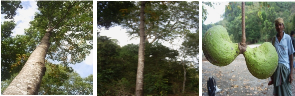
Gambar (Figure) 1. Pohon nitas ( Sterculia foetida L.) dan jenis-jenis asosiasinya, dengan buahnya yang belum matang di lapangan ( Nitas tree ( Sterculia foetida L.) and species associations with the immature fruits on the fields )

dpl, cenderung memiliki intensitas cahaya dan suhu yang lebih tinggi, karena intensitas cahaya merupakan salah satu faktor yang berpengaruh terhadap pertumbuhan dan regenerasinya. Pada kondisi intensitas cahaya memadai, biodiversitas flora akan lebih tinggi dan diduga hal ini berpengaruh terhadap tingkat asosiasi tumbuhan nitas. Dugaan ini sejalan dengan teori distribusi vegetasi, bahwa secara umum makin tinggi tempat tumbuh, makin sedikit tingkat keragaman jenisnya.