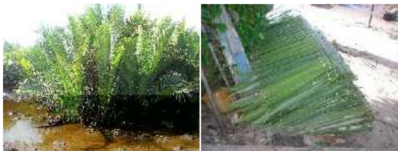
Gambar (Figure) 1. Nipah ( Nypa fruticans ), sumber pendapatan tambahan masyarakat etnis Bugis ( Nipah as secondary source of income for Bugis ethnic )

tanaman buah-buahan di Kalimantan cukup tinggi dan beberapa diantaranya termasuk endemik yaitu 24 jenis mangga liar seperti kasturi ( Mangifera casturi Griff.) dan 16 jenis rambutan ( Nephelium sp.) dan durian ( Durio sp.) (Michon, 2005).