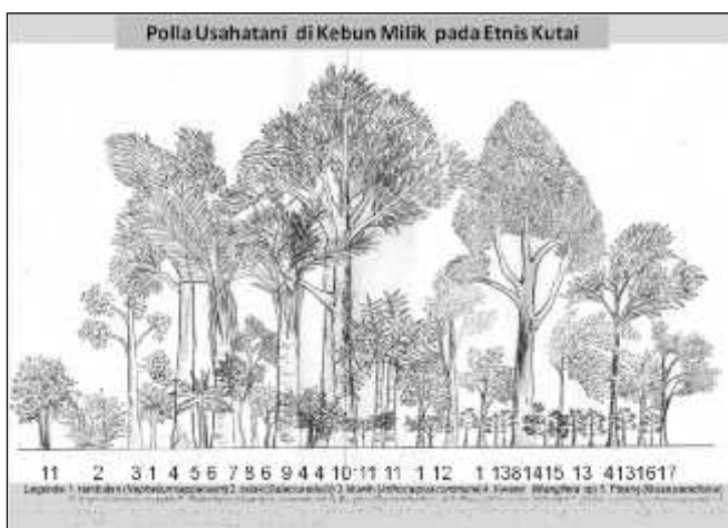
Gambar (Figure) 3. Pola usahatani di kebun milik pada etnis Kutai ( Farming pattern of private land of Kutai ethnic community )