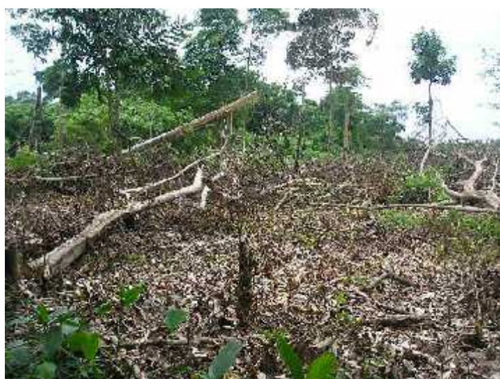
Gambar (Figure) 5. Areal perambahan dalam kawasan TNK (Encroachment areas in Kutai National Park)