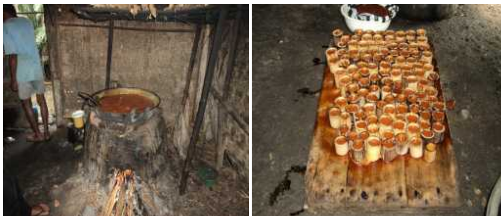
Gambar (Figure) 2. Proses pembuatan gula nipah ( Making process of nypa sugar )