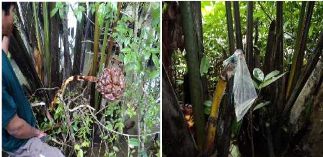
Gambar (Figure) 1. Buah muda nipah disadap niranya ( Nypa's sap was being tapped from young fruits )

Pembuatan gula merah, yaitu nira direbus selama lima jam pada panci sampai mengental kemudian dimasukkan dalam wadah (Gambar 2). Petani nipah/orang dalam satu hari dapat menghasilkan 50 liter nira, dalam satu liter nira dapat dihasilkan lebih kurang 200 gram gula nipah. Kadar gizi gula nipah disajikan pada Tabel 7.