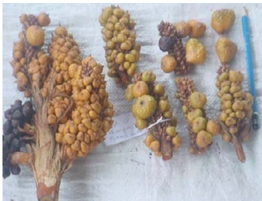
Gambar (Figure) 2. Buah asam paya muda (The unripe fruits of asam paya)