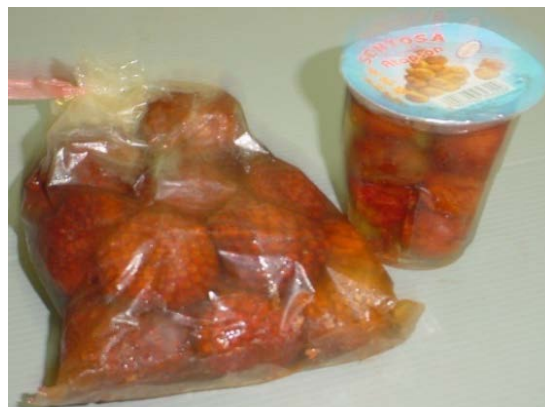
Gambar (Figure) 3. Manisan buah asam paya ( E. conferta ) (The fruit jam of asam paya E. conferta )