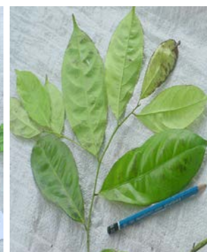
Gambar (Figure) 10. Ixora grandifolia Zoll. & Moritzi