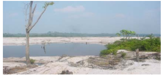
Gambar (Figure) 1. Padang pasir dalam kawasan hutan ( The desert in the forest area )

Spesies tumbuhan potensial yang dimaksud adalah potensial dalam hal pemanfaatannya oleh masyarakat setempat.