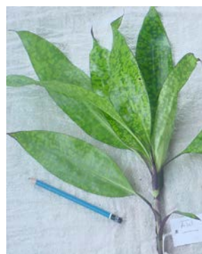
Gambar (Figure) 9. Cordyline fruticosa Backer