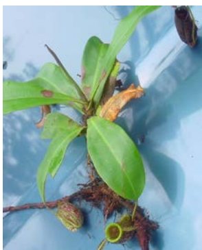
Gambar (Figure) 7. Nepenthes ampullaria Jack

Kondisi kawasan hutan CA Mandor telah mengalami kerusakan cukup parah, keadaan ini dapat menyebabkan ke-30 jenis tumbuhan potensial di lokasi penelitian akan menjadi langka dan dikhawatirkan terancam punah. Untuk itu perlu adanya upaya penyelamatan plasma nutfah melalui kegiatan konservasi, dan konservasi ex-situ diprediksi lebih baik dibanding in-situ . Namun demikian dalam pelaksanaan konservasi ex-situ akan lebih sulit, karena sebelum pelaksanaan kegiatan seluruh persyaratan tumbuh dan teknik silvikultur harus sudah dikuasai. Konservasi