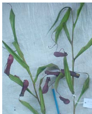
Gambar (Figure) 8. Nepenthes gracilis Korth.