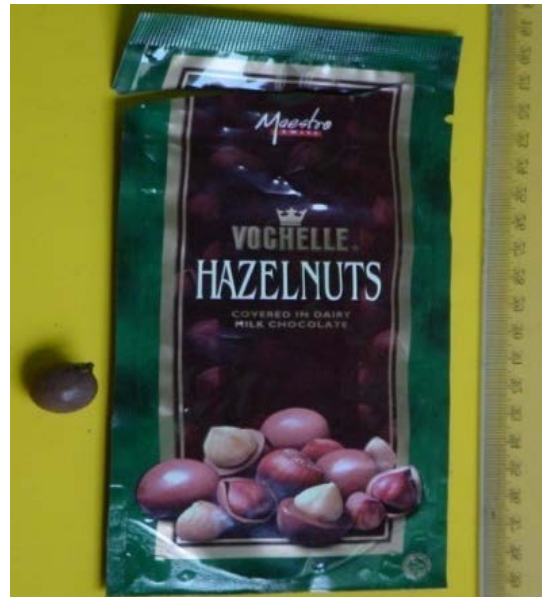
Gambar (Figure) 4. Biji Lithocarpus yang dibungkus susu coklat ( The hazelnuts of Lithocarpus covered in the dairy milk chocolate )

N. lappaceum , dan empat spesies berpotensi sebagai penghasil kayu komersial ialah B. kurzii , C. brachiata , G. celebica , N. glabrum .