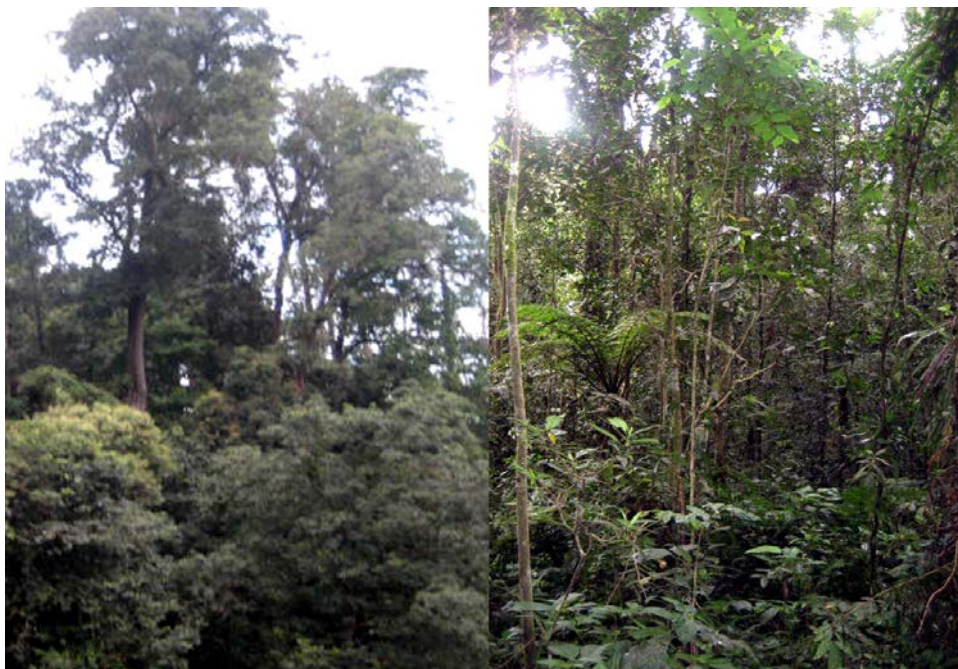
Gambar (Figure) 2. Gambar sebagian komposisi tumbuhan pada hutan primer di zona rimba di TNBG, Sumatera Utara ( A part of flora composition of primery forest in wilderness zone at BGNP, North Sumatra ).