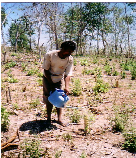
Gambar (Figure) 1. Penyiraman irigasi tetes dengan menggunakan wadah dari bambu ( Watering of drip irrigation using bamboo container )