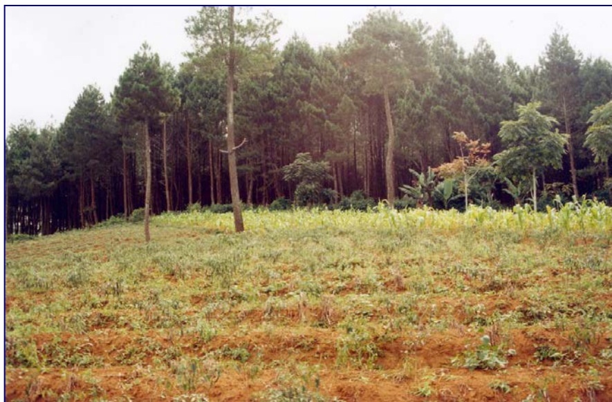
Gambar (Figure) 2. Tanaman hortikultur yang berbatasan dengan TNGC ( Horticulture plants on the border of Gunung Ciremai National Park )

Hkm (hutan kemasyarakatan, community forestry ); Ag (wanatani, agroforestry ); Ds (desa, villages ); Pm (pemukiman, housing ); Pt (pertanian, agriculture ); Hr (hutan rakyat, farm forestry ); Wa (wisata alam, nature recreation ); Wi (wisata air, water recreation ); Pri (perikanan, fishery ); S (sawah, padi field ); K (kebun, field ); Ht (hutan tanaman, plant forest )