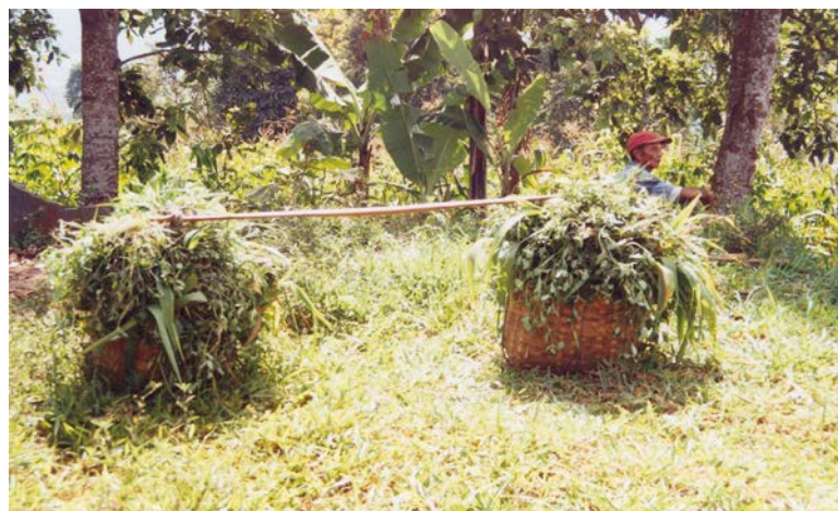
Gambar (Figure) 6. Pemanfaatan tumbuhan bawah di wanatani jalur interaksi daerah penyangga TNGC untuk pakan ternak ( The use of underground plants of agroforestry for fodder at interaction zone of buffer zone of Gunung Ciremai National Park ).