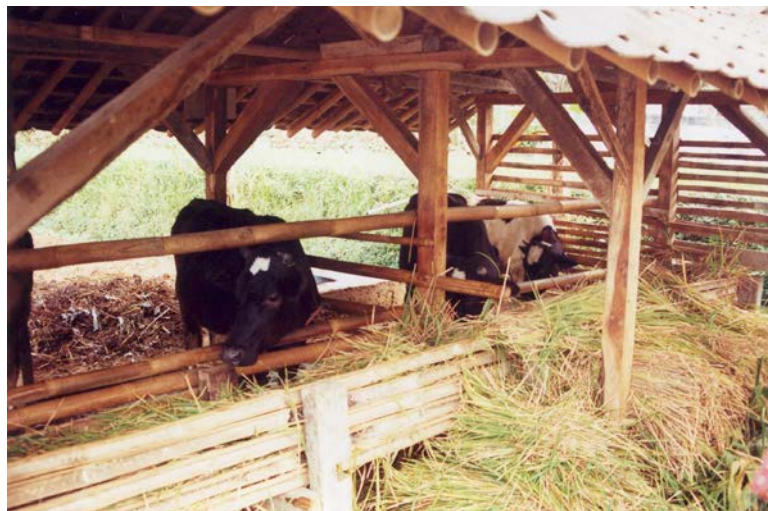
Gambar (Figure) 5. Peternakan sapi perah di Desa Pajabon, jalur interaksi daerah penyangga TNGC ( Animal husbandry of dairy cow at Pajabon Villages in interaction zone of buffer zones of Gunung Ciremai National Park )