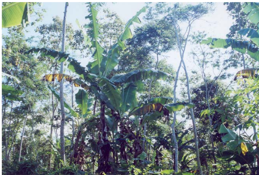
Gambar (Figure) 3. Keragaman jenis tanaman berjarak 1,5 km dari batas TNGC ( Plant biodiversity which is distanced 1.5 km from the border of Gunung Ciremai National Park )

Di lahan wanatani masyarakat Desa Gn. Halimun, Jawa Barat, keragaman jenis flora hutan yang dikembangkan untuk kepentingan bangunan, sumber pakan, obat tradisional, kayu bakar, pakan ternak, dan upacara adat sejumlah 464 jenis (Harada, 2001). Sedangkan, jenis tanaman utama yang dibudidayakan 20 jenis pohon bernilai ekonomis tinggi dan cepat tumbuh. Jenis pohon yang dikembangkan di lahan wanatani di antaranya adalah Maesopsis eminii , Agathis alba , Swietenia macrophylla , Durio zibethinus , Melia azedarach , Paraserianthes falcataria , dan Peronema canescens .