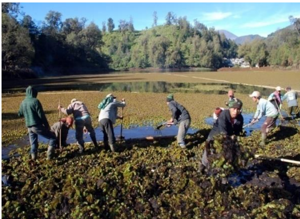
Gambar (Figure) 3. Pembersihan Danau Ranu Pane ( The cleaning of Ranu Pane Lakes )

tutupan vegetasi di daerah tangkapan air, yaitu dari hutan hujan tropis pegunungan menjadi lahan garapan atau perladangan dan pemukiman. Perubahan tutupan vegetasi disertai meningkatnya aktivitas manusia (pertanian, pemukiman dan kegiatan wisata) telah berdampak pada penurunan kualitas perairan danau. Hasil analisis terhadap air Danau Ranu Pane dan Ranu Regulo membuktikan telah terjadi penurunan kualitas baik secara fisika, kimia, dan biologi. Bukti lain, penurunan kualitas perairan Danau Ranu Pane adalah berkembangbiaknya secara invasif tumbuhan air ki ambang ( Salvinia molesta Mitchell) yang mampu menutupi badan danau sekitar 80%. Upaya konservasi terhadap kondisi kedua danau dapat dilakukan dengan cara melakukan pengayaan ekosistem alami hutan hujan tropis pegunungan di sekitar Danau Ranu Pane dan Ranu Regulo, sistem pertanian dengan metode terracing , dan penggunaan pupuk yang tidak berlebihan, serta pengendalian tumbuhan invasif di dalam danau.