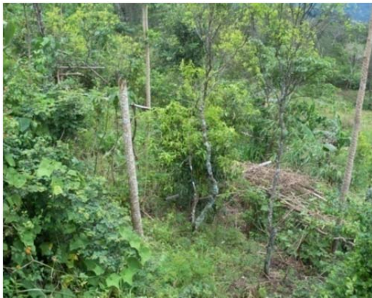
Gambar (Figure) 4. Tanaman cendana tumbuh pada kelereng 90% ( Cendana plantation growing on land with 90% slope )

Analisis data primer ( Primary data analysis )