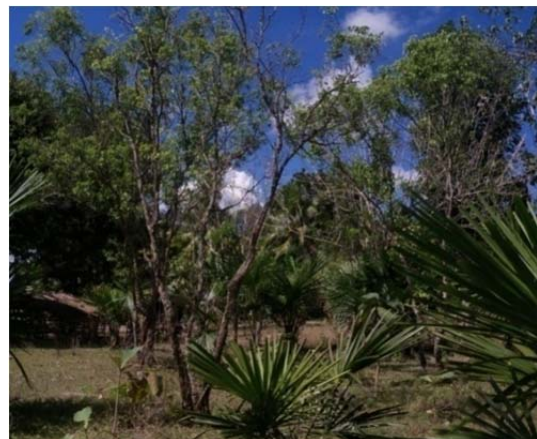
Gambar (Figure) 5. Tanaman cendana tumbuh pada lahan landai di Kabupaten TTU ( Sandalwood plantation growing on a flat land in TTU Regency )

Analisis data primer ( Primary data analysis )