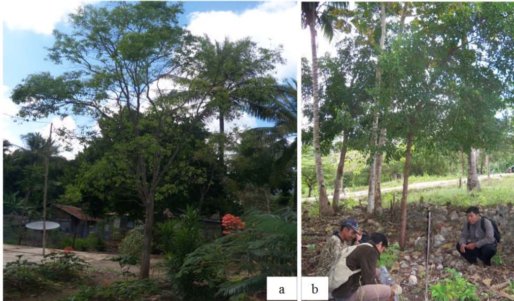
Gambar (Figure) 6. a. Tanaman cendana dengan naungan ringan; b. dengan naungan berat (a. Cendana plantation with low shading; b. with heavy shading)