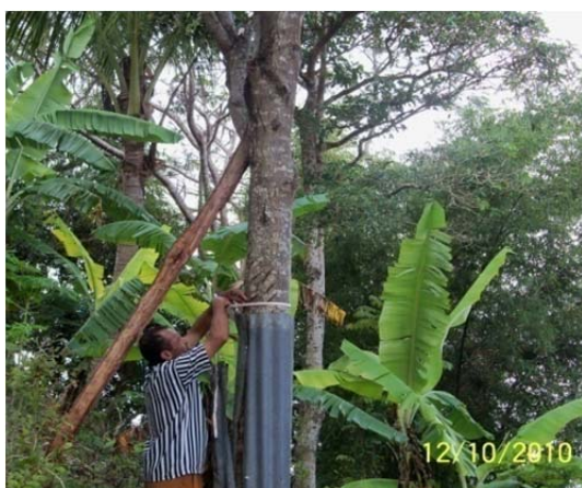
Gambar (Figure) 3. Pohon cendana di Desa Baki, Kabupaten TTS ( Sandalwood tree in Baki Village, TTS Regency )