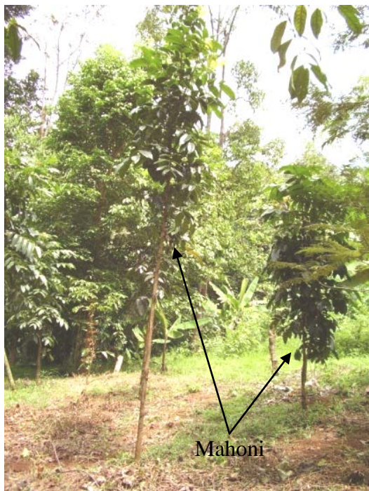
Gambar (Figure) 3. Tanaman mahoni umur 3 tahun ( Mahogany trees at three years old )

tinggi tanaman telah mencapai empat kali lipat dibandingkan kondisi awal, bahkan diameter batangnya mampu mencapai tujuh kali lipat. Pada tahun ketiga tersebut, pertumbuhan diameter juga menunjukkan angka terbesar dibandingkan pertumbuhan pada tahun pertama dan kedua.