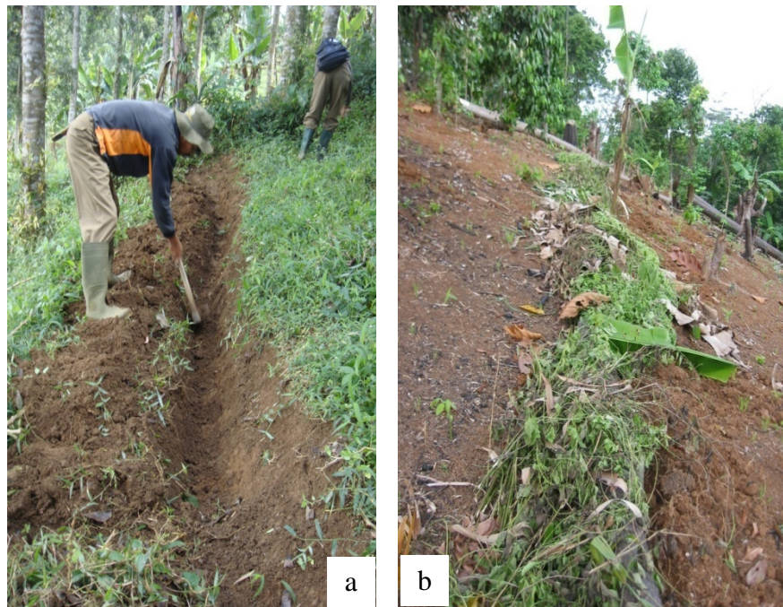
Gambar (Figure) 1. Pembuatan saluran mulsa vertikal ( Establishment of vertical mulch channel ) (a); saluran telah diisi mulsa ( channel has been filled by mulch ) (b)

Pengamatan plot erosi dilakukan selama satu tahun. Pengamatan erosi dan aliran permukaan dilakukan pada setiap kejadian hujan dengan mencatat curah hujan, jumlah air yang tertampung dalam bak, dan contoh air diambil dari air yang tertampung dalam bak.