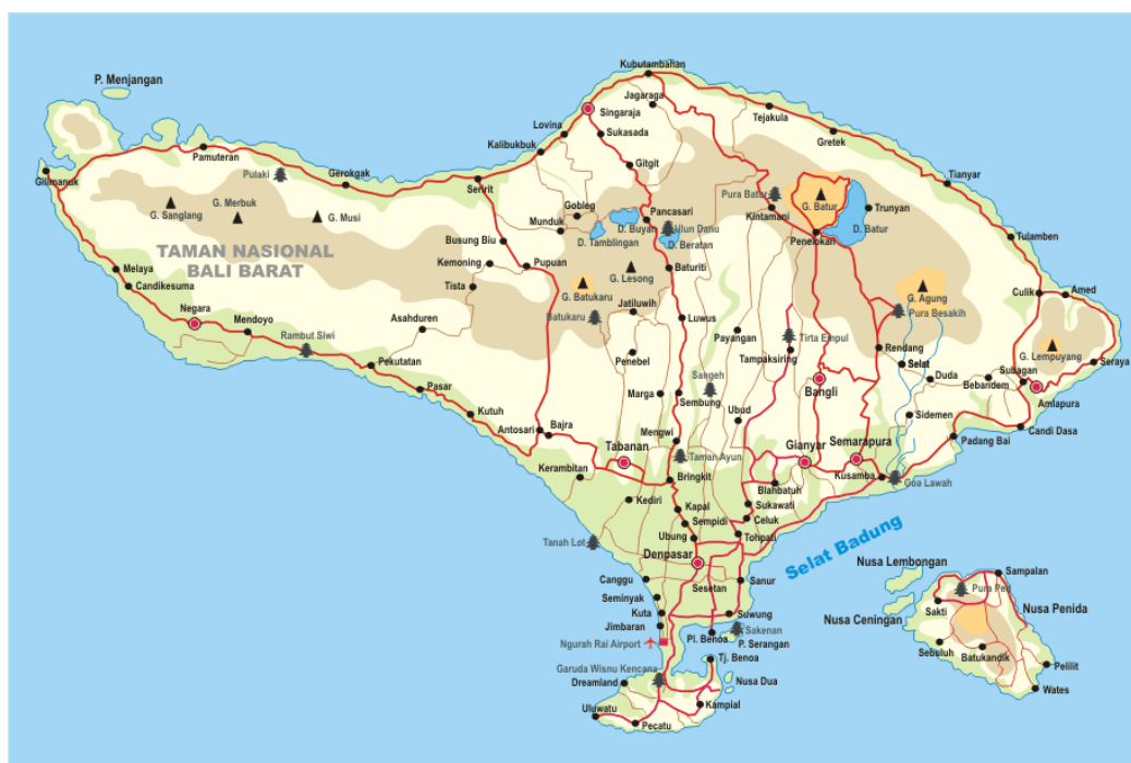
Gambar (Figure) 1. Peta lokasi penelitian ditunjukkan panah berwarna hijau ( Map of the research location indicated by the green arrow )

Fase fenologi paku dipengaruhi oleh faktor ekstrinsik dan intrinsik. Tidak banyak informasi mengenai pengaruh faktor intrinsik sementara faktor ekstrinsik sebagian besar berupa iklim (Mehlreter, 2008). Fenologi paku dilaporkan dari beragam daerah dengan iklim yang berbeda. Di Taiwan bagian utara, dimana tidak terdapat perbedaan musim kemarau yang jelas, daun yang muncul tidak berkorelasi dengan suhu dan curah hujan. Sementara tahapan fenologi yang lain seperti daun berkembang, daun layu, spora matang dan lepas memiliki korelasi positif yang signifikan dengan suhu ((Lee et al. , 2009).