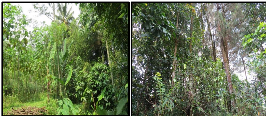
Gabar (Figure) 3. Pola tanam hutan rakyat luasan kecil ( The cropping pattern in small-scale private forest )

hanya bisa disisipkan sedikit tanaman buah-buahan sebagai tanaman tambahan saja dengan jarak tanam yang lebih lebar.