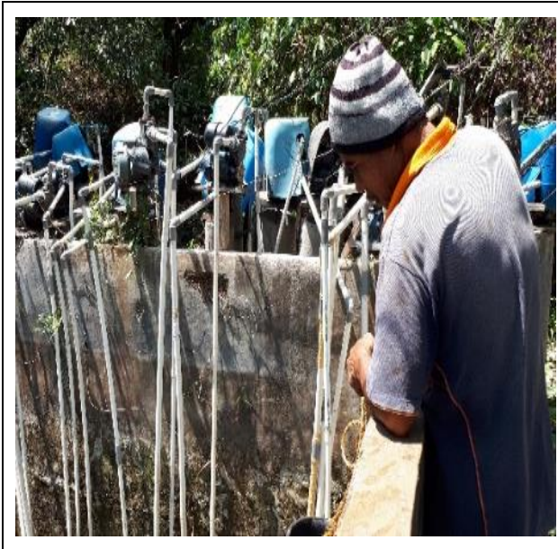
Gambar 2. Pengambilan air menggunakan pompa air ketika musim penghujan

Figure 2. Taking water usually uses a water pump during the rainy season