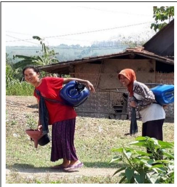
Gambar 4. Pengambilan air dengan menggunakan jerry can dengan berjalan kaki Figure 4. Taking water using jerry can on foot

Figure 3. Taking water using bucket during the dry season because the water flow decreases a lot