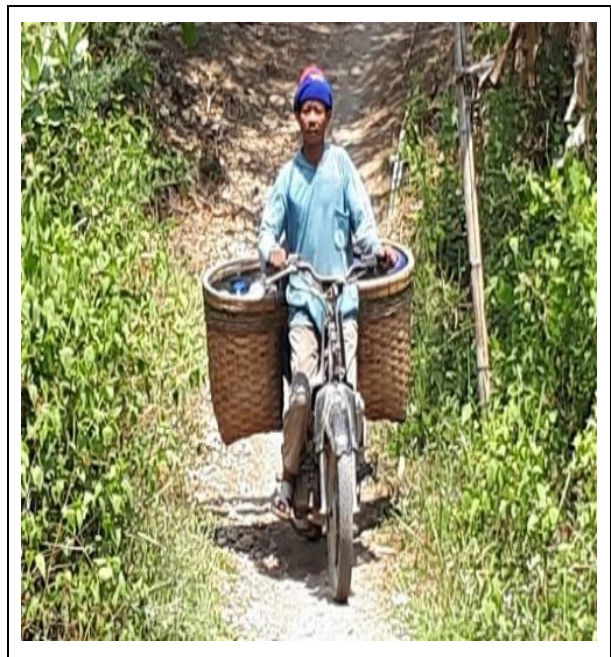
Gambar 5. Pengambilan air dengan menggunakan kendaraan bermotor, jerry can dimasukkan ke rombong Figure 5. Taking water using a motorized vehicle, jerry cans are put into rombong