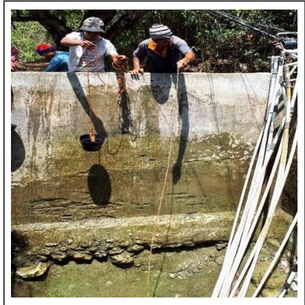
Gambar 3. Pengambilan air menggunakan timba ketika musim kemarau karena debit air berkurang banyak

Figure 2. Taking water usually uses a water pump during the rainy season