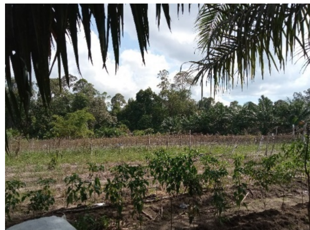
Gambar 2. Lokasi pemancingan (kiri) untuk wisata dan areal pertanian yang merupakan potensi Kelurahan Bukit Datuk