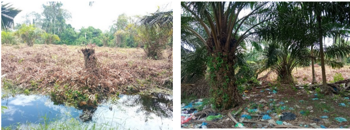
Gambar 3. Problem sampah di Kelurahan Bukit Datuk Figure 3. Waste problem in Bukit Datuk Village