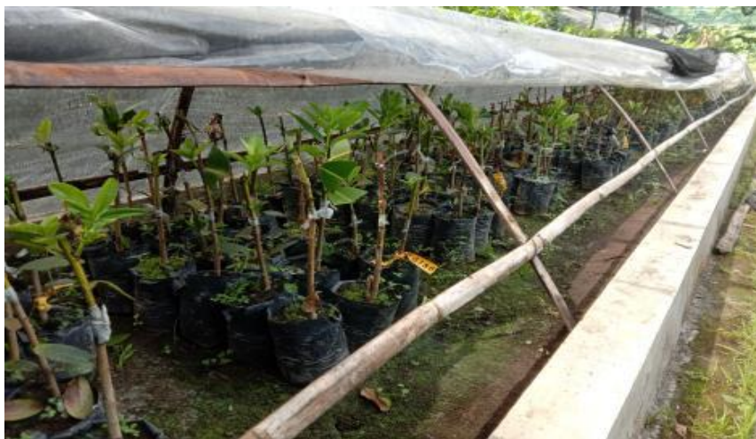
Gambar 4. Sambungan nyamplung tumbuh dalam bedengan sungkup umur 2 bulan

dan diameter relatif sama. Adanya variasi tersebut dimungkinkan karena adanya ketidaksesuaian atau inkompatibilitas antara scion dan rootstock (Mahunu et al. , 2013) dan perbedaan kondisi fisiologis scion maupun maupun vigoritas bibit rootstock yang digunakan (Alcaraz-lópez et al. , 2010 dan Mng'omba et al. , 2010). Selain itu upaya menjaga kesegaran scion sangat penting dilakukan karena dengan berkurangnya kelembaban pada wadah penyimpanan dapat menyebabkan scion menjadi layu/tidak segar. Berdasarkan hasil penelitian sebelumnya yang menggunakan scion nyamplung dari Yogyakarta sehingga dapat segera disambung di persemaian menunjukkan persentase hidup yang tinggi sampai minggu ke-5 sekitar 64 – 100 % (Adinugraha et al. , 2012).