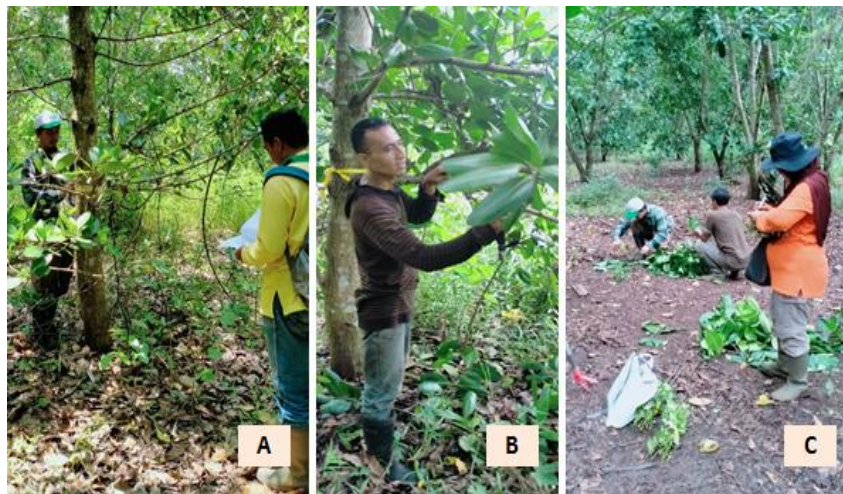
Gambar 1. Pengambilan scion di tegakan benih provenans nyamplung di Wonogiri

dilanjutkan dengan pengambilan scion berupa ranting-ranting yang sehat dari pohon induk yang sudah diseleksi (Gambar 1B). Pengambilan ranting dari tajuk bagian bawah sesuai dengan hasil penelitian sebelumnya (Adinugraha et al. , 2012). Ranting dipotong dengan ukuran 30 – 40 cm dan dipilih yang berdiameter rata-rata \leq 1 cm. Daun-daun yang terdapat pada ranting selanjutnya dipotong sebagian dengan menggunakan gunting stek. Ranting-ranting tersebut dikelompokkan, diikat dan diberi label sesuai dengan nomor pohon induknya (Gambar 1C). Setiap ikatan ranting selanjutnya disusun di dalam ice box berukuran besar yang telah diisi es batu terlebih dahulu untuk menjaga kelembaban scion selama pengangkutan ke persemaian BBPPBPTH di Yogyakarta. Pelaksanaan kegiatan pengambilan scion di lapangan dan pengangkutan ke persemaian memerlukan waktu sekitar 1 hari, maka scion tetap disimpan dalam es box untuk disambung pada hari berikutnya. Untuk menjaga agar es box tetap lembab, maka dilakukan penggantian es batu yang sudah mencair.