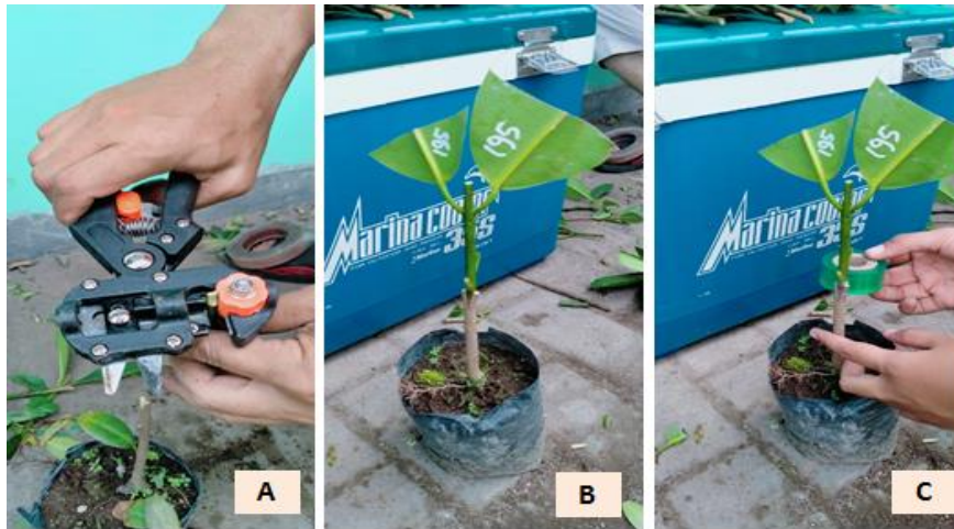
Gambar 2. Pembuatan sambungan klon nyamplung di persemaian

menjaga kelembaban udara yang tinggi pada bedengan tersebut serta diberi naungan paranet dengan intensitas naungan sekitar 55 %. Pembuatan sambungan mulai dari pemotongan bagian tanaman rootstock dan scion sampai menyambungkan keduanya dilakukan oleh seorang teknisi yang sudah terampil. Selanjutnya untuk mengikat bagian sambungan dengan parafilm dan menyusun bibit pada bedengan dibantu oleh 2 orang teknisi lainnya, sehingga proses penyambungan scion lebih cepat.