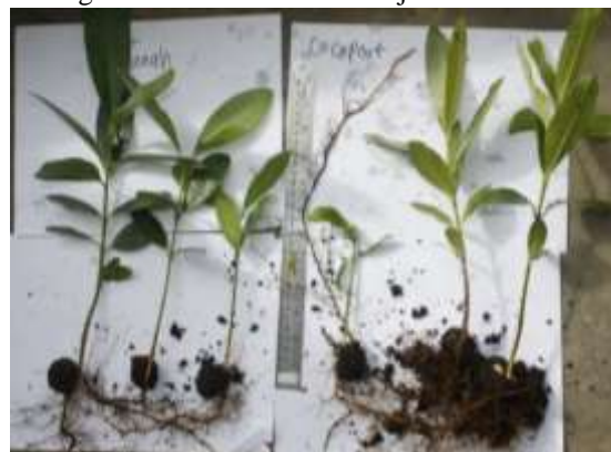
Gambar 1. Penampilan bibit dari media tanah (kiri) dan serabut kelapa (kanan)

Media semai merupakan komopenen utama dalam pembuatan tanaman. Media memiliki kandungan organik dan sifat fisika-kima yang berbeda – beda. Hal ini berpengaruh terhadap proses aerasi dan drainase, sehingga akan berpengaruh terhadap karakteristik pertumbuhan suatu tanaman. Pemilihan kedua jenis media yang dipakai dalam penelitian ini adalah dasar pemilihan media yang lebih mudah ditransportasikan, biaya dan efisiensi penyiraman dan pemupukan. Gambar 1 menunjukkan karakteristik bibit nyamplung dari 2 media, sedangkan secara kualitatif ditunjukkan Tabel 1.