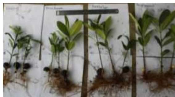
Gambar 2. Penampilan bibit dari perlakuan kontrol, perendaman, peretakan dan pengupasan

Menurut Suryawan et al. (2014) untuk mendapatkan viabilitas benih nyamplung yang tinggi membutuhkan perusakan cangkang atau pengupasan. Hal ini agar air mampu mencapai benih. Perlakuan yang diberikan tentunya harus berhati-hati karena benih didalam bisa mengalami kerusakan. Berdasarkan hasil ujicoba 1, ujicoba ini menggunakan media cocopeat . Berikut kenampakan bibit nyamplung yang dihasilkan pada bulan ketiga berdasarkan penanganan benih (Gambar 2) dan hasil rekapitulasi analisis sidik ragam (Tabel 2).