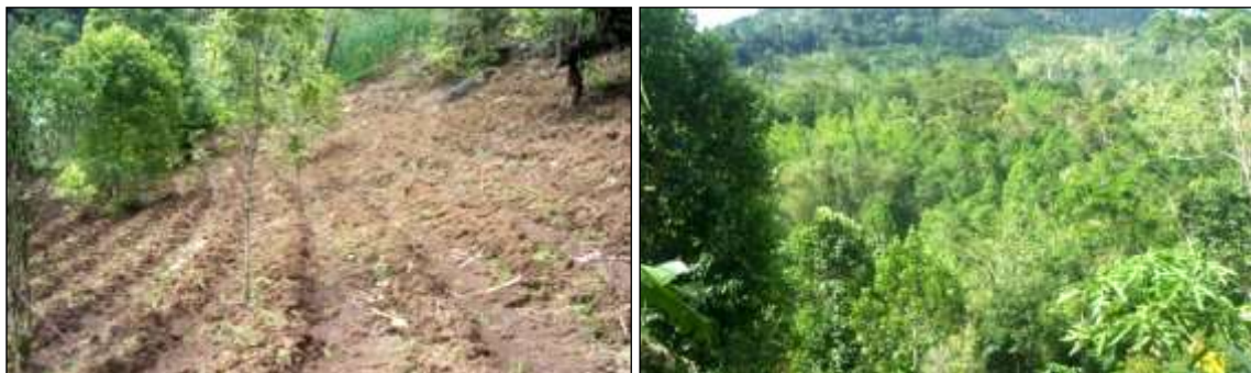
Gambar 2. Bentuk usaha tani konservasi pada lahan kelas kemampuan VI di DTA Timur danau (kebun campuran dan sistem teras tradisional) Foto : lokasi lahan pertanian Desa Makalonsow dan Eris

Keterangan : Kc = kebun campuran, Sw = sawah, Hp = hutan primer, Hs = hutan sekunder, Pm = pemukiman