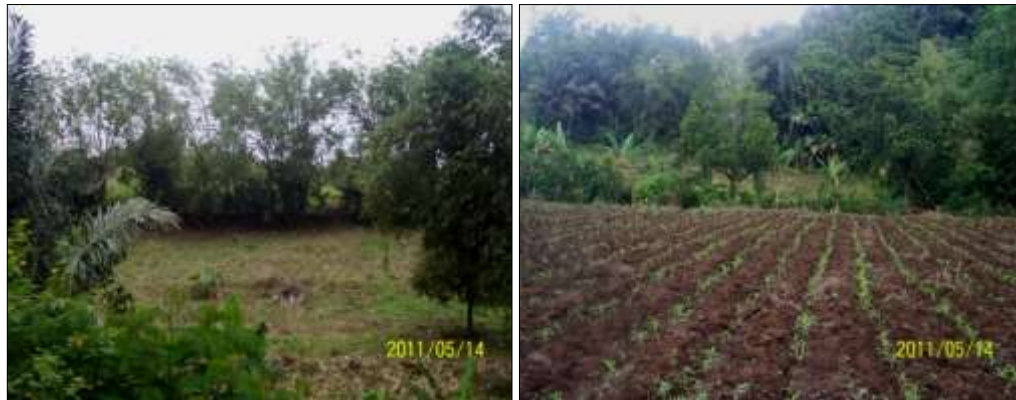
Gambar 4. Sistem usaha tani konservasi lahan kering di sub DTA Barat (metode vegetatif tanaman pagar dan teras sederhana) Foto : lahan pertanian Desa Leleko dan Tampusu Kecamatan Remboken)