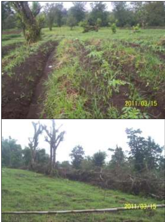
Gambar 3. Sistem usaha tani konservasi lahan kering di DTA Selatan (pola agroforestri, teras guludan dan manajemen bahan organik) foto lahan pertanian di desa Toure dan Tumaratas)

dominan sedangkan tanaman kayu-kayuan sisipan). Masinambow (2011) menginventarisasi jenis-jenis pohon yang dijumpai pada sistem agroforestri di DTA Selatan. Jenis yang paling banyak adalah kayu kanonang ( Biscofia sp.) Tayapu ( Trema orientalis ), dadap ( Erytrina sp.), cempaka ( Elmerilia ovalis ) dan Mahoni ( Switenia mahogany ). Tanaman Kayu-