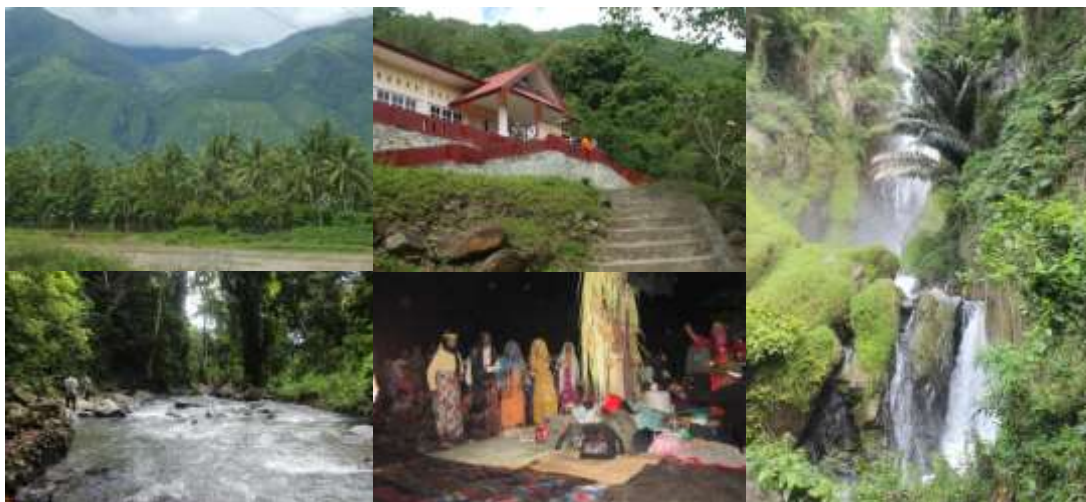
Gambar 1. Potensi wisata Taman Wisata Alam Wera

Aspek-aspek penawaran wisata terdapat di TWA Wera, yaitu: 1) sumberdaya wisata alam dan budaya (pemandangan alam, Air Terjun Wera, Sungai Wera, flora, fauna, atraksi budaya dan kuliner, religius, dan produk daerah sekitar TWA Wera); 2) akomodasi atau penginapan; 3) fasilitas dan pelayanan; 4) infrastruktur; 5) elemen institusi; serta 6) masyarakat sekitar TWA Wera.