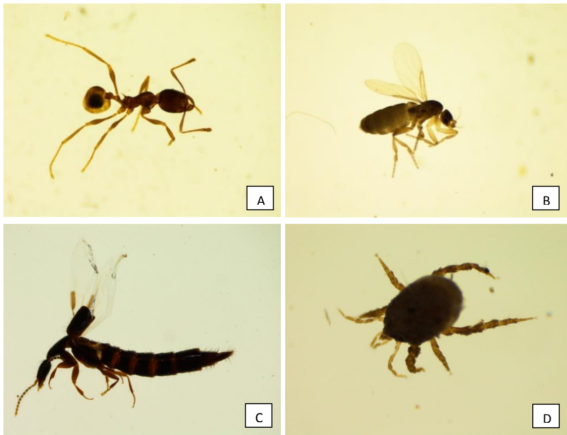
Keterangan : A. salah satu famili Formicidae, B. famili Rhagionidae, C. famili Staphylinidae, D. Acari