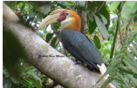
Julang Irian ( Rhyticeros plicatus )

dipulau Halmahera (Burung Indonesia, 2011). Belum banyak informasi ilmiah terkait kondisi populasi jenis-jenis endemik tersebut di alam. Kajian ini penting mengingat cepatnya laju pengerusakan hutan di wilayah halmahera akibat pemanfaatan kawasan untuk peruntukan tambang, transmigrasi dan Ijin Usaha Pemanfaatan Hasil Hutan Kayu (IUPHHK) yang kebablasan serta maraknya perdagangan satwa.