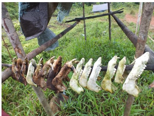
Gambar 4. Tengkorak babi hutan buruan masyarakat pada kawasan TNAL

Kawasan ini juga menjadi tempat bagi masyarakat memperoleh belut sungai atau Sogili ( Anguilla sp. ), jenis ini dapat ditemukan pada hutan Akejawi, hutan Bukit Durian dan hutan Tayawi. Olahan Sogili menjadi salah satu makanan kegemaran masyarakat yang bermukim di sekitar TNAL, umumnya jenis ini sering ditangkap bersama udang untuk keperluan konsumsi. Masyarakat juga seringkali memburu dan menangkap kuso ( Cuscus ornatus ) untuk dikonsumsi. Jenis-jenis kelelawar ditemukan disemua zona, pada zona peyangga jenis ini ditemukan pada lahan-lahan masyarakat. Selain itu kawasan ini juga mendukung kehidupan tikus, ular sanca, beberapa jenis katak, kupu-kupu, kadal dan serangga.