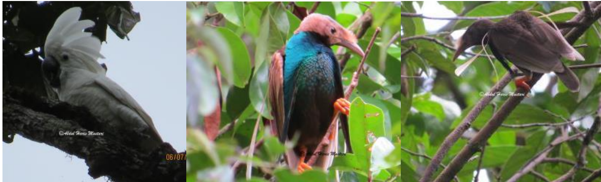
Kakatua Putih, Cacatua alba

ditegakkan, bulu-bulu mekar dan ekornya berwarna kuning. Selama kurun waktu sepuluh tahun populasi alba jauh menurun dibandingkan hasil survei pada tahun 1999. Faktor utama hilangnya Cacatua alba dalam 12 tahun terakhir adalah penangkapan secara berlebihan di alam. Sehingga menyebabkan burung ini telah menghilang dari beberapa kawasan di Pulau Halmahera. Populasi terbesar jenis ini berada di bagian barat (semenanjung utara dan selatan) Pulau Halmahera (Burung Indonesia, 2011).