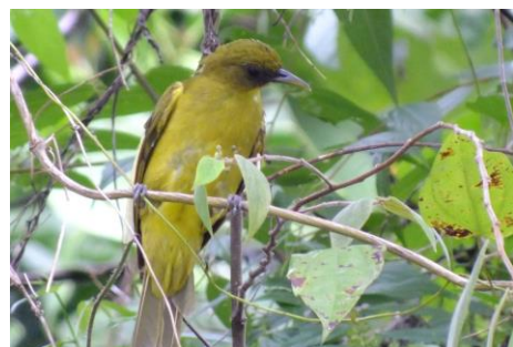
Brinji Emas ( Ixos affinis )