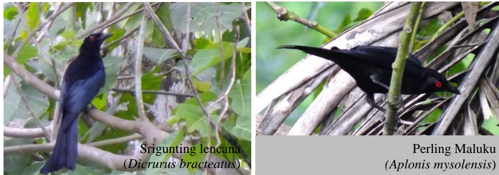
Gambar 2. Burung-burung pada zona peyangga