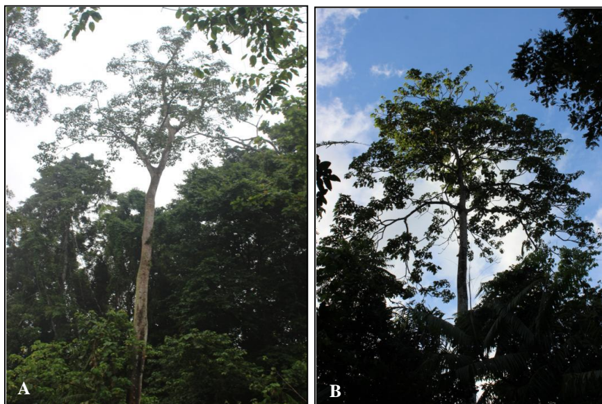
Gambar 3. Morfologi (a). Binsar ( Ficus variegata ) dan (b). Lawean ( Sterculia sp.) (The morphology of Binsar and Lawean)

Lawean banyak tumbuh di dekat sungai dan umumnya memiliki bentuk percabangan menyebar dan terkulai. Tipe percabangan lawean sangat berbeda dengan pohon gehe yang memiliki arah tumbuh cabang ke atas/vertikal. Lawean banyak dijumpai tumbuh pada daerah hutan dataran rendah hingga perbukitan sampai pada ketinggian 2000 m dpl, baik di hutan primer maupun hutan sekunder. Buah dari pohon lawean sangat digemari oleh kelelawar dan juga sangat disukai sebagai tenggeran jenis-jenis merpati columbidae. Jenis Sterculia foetida dilaporkan digunakan oleh burung kakatua putih ( Cacatua sulphurea ) sebagai tempat bersarang dan pohon tidur di TN. Komodo, di Bali jenis ini sangat disukai oleh burung jalak bali sebagai tempat bertengger. (Ginantra et al. , 2009) dan untuk Cacatua sulphurea citrinocristata di TN. Laiwangi Wanggameti buah pohon Sterculia foetida adalah sumber pakan (Hidayat, 2014).