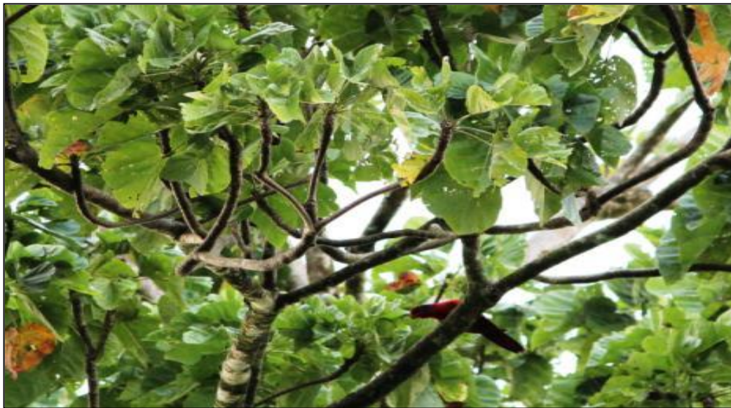
Gambar 4. Sampiri yang bertengger di pohon lawean ( Sterculia sp.)

budidaya yang pohonnya sedikit (Coates dan Bishop, 1997). Selain itu ditemukan juga spesies burung kirik-kirik australi ( Merops ornatus ) yang menggunakan pohon gehe sebagai pohon bertengger untuk mencari makan. Selain aktivitas membuat sarang keberadaan burung-burung ini yang semuanya adalah pemakan serangga ( insektivora ) diduga juga ada keterkaitan dengan mekanisme untuk mengurangi atau menghindari adanya parasit melalui kehadiran burung perling kumbang, kepodang kuduk hitam dan kirik-kirik australi yang merupakan pemakan serangga ( insectivora ). Kowalewski dan Zunino (2005) menjelaskan bahwa mekanisme menghindari parasit umumnya dilakukan oleh primata yang menggunakan pohon tidur secara berkelompok dengan melakukan pergantian pohon tidur sesekali. Hal ini juga diduga terjadi pada koloni burung sampiri dalam melindungi pohon tidurnya yaitu dengan adanya mekanisme simbiosis dengan spesies burung lain untuk mengurangi atau menghindari parasit pada pohon tidurnya dan fenomena ini sangat menarik untuk dikaji lebih dalam.