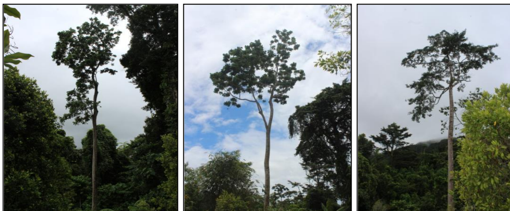
Gambar 2. Morfologi Gehe ( P. corriaceae ) yang dipilih sebagai pohon tidur oleh Burung Sampiri

Pohon gehe yang digunakan sebagai pohon tidur menunjukkan bentuk morfologi pohon tinggi, batang lurus dan tinggi bebas cabang yang juga tinggi. Burung paruh bengkok yang menghuni habitat Hutan Aisandami di Taman Nasional Cendrawasih Papua juga sangat menyukai pohon matoa baik P. pinnata dan P. corriaceae sebagai tempat bermain, istirahat maupun berkembangbiak (Warsito dan Bismark, 2010).