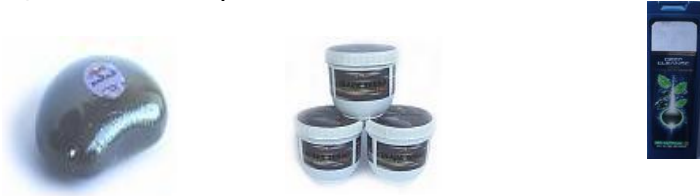
Gambar 4. Produk yang menggunakan bahan tambahan arang aktif: sabun (kiri), lulur (tengah) dan sampo (kanan)

pemurnian larutan, seperti industri gula, sirup, air minum, sayuran, lemak, minyak, minuman alkohol, bahan kimia dan farmasi; penyerap gas beracun pada masker; penghilang bau pada sistem alat pendingin; penyerap emisi uap bahan bakar pada otomotif serta sebagai filter rokok (Austin, 1984; Harris, 1999). Arang aktif juga telah digunakan sebagai bahan tambahan dalam produk untuk pemeliharaan kebersihan dan kehalusan kulit dan rambut, antara lain sabun, lulur dan sampo.