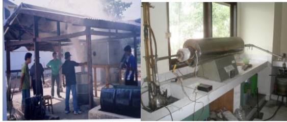
Gambar 1. Pembuatan arang menggunakan kiln drum (kiri) dan pembuatan arang aktif menggunakan retort listrik dan steam boiler skala laboratorium (kanan).