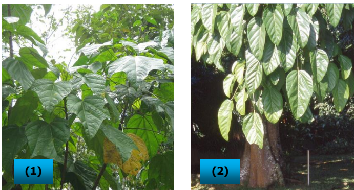
Gambar 3. (1) daun dari pohon muda berlekuk tiga; (2) daun dari pohon tua berbentuk bulat telur dengan pangkal melebar dan ujung daun meruncing.

Pohon pangi memiliki daun tunggal, mengumpul di ujung ranting dan bertangkai panjang. Helaian daun dari pohon muda berlekuk tiga sedangkan pada pohon tua helaian daun berbentuk bulat telur melebar di pangkal berbentuk jantung dan ujung daun meruncing. Permukaan atas daun licin berwarna hijau mengkilap, permukaan bawahnya berambut cokelat dan tersusun rapat. Tulang daun pada sisi bawah menonjol. Panjang daun sekitar 20 - 60 cm dan lebar 15 - 40 cm. Daun-daun yang gugur meninggalkan bekas yang jelas (Heyne, 1987; Heriyanto dan Subiandono, 2008).