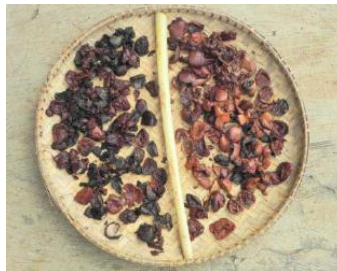
Gambar 5. Daging biji pangi saat proses penjemuran (Sumber: Mahandari, et al. , 2011)

Biji pangi merupakan alternatif bahan pengawet alami yang tidak berbahaya. Pemanfaatan biji pangi sebagai pengawet alami bukan merupakan hal yang baru. Hal ini diadopsi dari pengalaman sebagian masyarakat nelayan di Kecamatan Labuhan, Kabupaten Pandeglang, Banten, dalam membantu proses pengawetan ikan dan hasilnya sangat efektif jika dibandingkan menggunakan formalin dan proses pembuatannya pun sangat sederhana dan tidak membutuhkan waktu yang lama. Cara pengolahan untuk bahan pengawet, yaitu buah yang telah masak diambil bijinya kemudian dibelah, daging yang terdapat di dalam biji (endosperm) dicincang dan kemudian dijemur selama dua sampai tiga hari. Tekstur daging biji yang telah dijemur menjadi lebih keras dan padat. Hasil cincangan tersebut kemudian dimasukkan ke dalam perut ikan yang telah dibersihkan isi perutnya. Efektivitas bahan pengawet pangi ini dapat digunakan selama enam hari. Sedangkan untuk pengangkutan ikan jarak jauh, bahan pengawet ini ditambahkan garam dengan perbandingan 1 : 3 (1 bagian garam dengan 3 bagian bahan pengawet). Bahan pengawet dari daging biji pangi ini dapat digunakan dengan cara pelumuran pada daging ikan kembung segar ( Rastrelliger brachysoma ), dengan cara ini pengawetan ikan dapat bertahan selama enam hari tanpa mengubah mutunya (Arini, 2012).