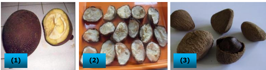
Gambar 4. (1) buah pangi, (2) biji pangi yang masih muda, (3) biji pangi yang sudah tua

Kulit buah berwarna coklat kemerahan dengan permukaan kasar yang mengandung lentisel . Aprianti (2011) menyatakan buah pangi mengandung biji yang jumlahnya banyak dan tersusun rapi pada poros buah seperti buah cempedak. Buah yang berukuran besar mengandung biji yang jumlahnya dapat mencapai 30 biji, sedangkan buah yang berukuran kecil mengandung sekitar 12 biji. Biji berukuran besar, berwarna kelabu, berbentuk limas dan keras. Pada biji terdapat inti biji (endosperm) yang banyak mengandung lemak . Buah yang masih segar, endospermanya berwarna putih, apabila buah sudah disimpan dalam waktu yang lama, maka warna endosperma berubah menjadi kehitaman. Daging biji mengandung senyawa golongan alkaloid, flavonoid, tanin dan sianida. Adanya tanin menyebabkan daging biji pangi menjadi cokelat. Reaksi tersebut dikenal dengan browning enzymatic , yang terjadi jika dikatalisis oleh enzim polifenolase dengan substrat berupa senyawa fenolik. Antara endosperma dengan tempurung dibatasi oleh selaput tipis berwarna coklat. Kulit biji kasar dengan perikarp setebal 6 - 10 mm, berkayu dan beralur.