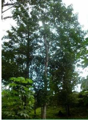
Gambar 1. Pohon Pangi ( Pangium edule Reinw.)

Familia : Flacourtiaceae Genus : Pangium Species : Pangium edule Reinw.