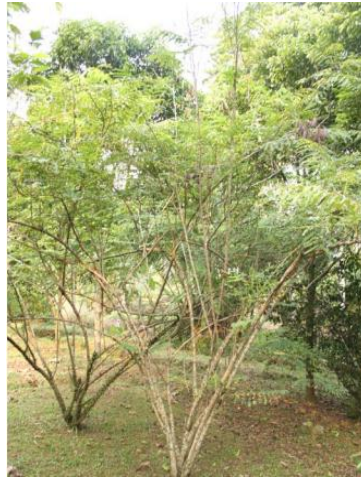
Gambar 1. Tanaman Secang ( Caesalpinia sappan L.)

nyet' (Burma), 'sbaeng' (Kamboja), 'fang deeng' (Laos), dan 'faang' (Thailand) (Pusat Pengembangan Pendidikan UGM, 2011).