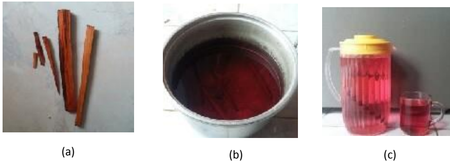
Gambar 4. (a) serpihan kayu secang; (b) serpihan kayu secang yang direndam dalam air panas; (c) air minum hasil rendaman kayu secang

Berikut gambar serpihan, proses ekstraksi, dan air hasil rendaman kayu secang.