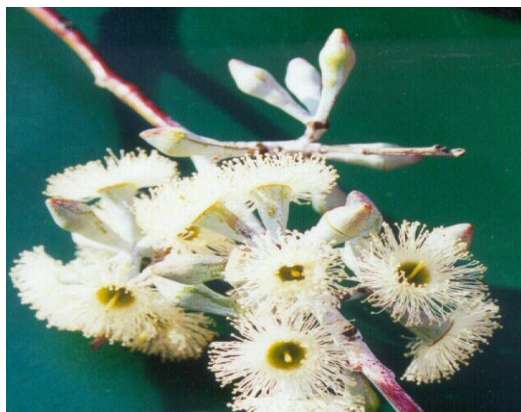
Gambar 2. Struktur bunga lengkap Eucalyptus sp. (Wilson, 2002).

Somerville and Moncur (1997) menyatakan bahwa 70% madu yang diproduksi di Australia berasal dari nektar bunga Eucalyptus sp. Produksi madu lebah A. mellifera yang menggunakan E. camaludensis sebagai sumber pakan adalah sekitar 30-50 kg/koloni yang diperoleh pada musim panas di Australia (Somerville, 2000). Selain itu, Dombro (2010) menyatakan bahwa pada musim berbunga E. pellita dapat menghasilkan madu sebanyak 54 kg dari jenis lebah A. mellifera (Tabel 1). E. pellita merupakan salah satu jenis yang dominan ditanam oleh perusahaan HTI di Provinsi Riau. Selain jenis E. pellita terdapat jenis Eucalyptus lain yang dapat dijadikan sebagai sumber nektar (Tabel 2).