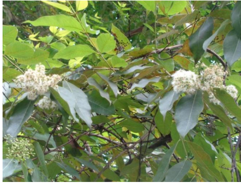
Gambar 1. Bunga Eucalyptus sp. di arboretum BP2TSTH Kuok

Somerville and Moncur (1997) menyatakan bahwa 70% madu yang diproduksi di Australia berasal dari nektar bunga Eucalyptus sp. Produksi madu lebah A. mellifera yang menggunakan E. camaludensis sebagai sumber pakan adalah sekitar 30-50 kg/koloni yang diperoleh pada musim panas di Australia (Somerville, 2000). Selain itu, Dombro (2010) menyatakan bahwa pada musim berbunga E. pellita dapat menghasilkan madu sebanyak 54 kg dari jenis lebah A. mellifera (Tabel 1). E. pellita merupakan salah satu jenis yang dominan ditanam oleh perusahaan HTI di Provinsi Riau. Selain jenis E. pellita terdapat jenis Eucalyptus lain yang dapat dijadikan sebagai sumber nektar (Tabel 2).